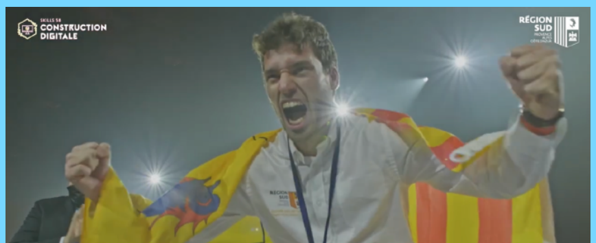
Un jeune apprenti très motivé !

Depuis 1990, ces Olympiades ont changé de nom pour prendre celui très stylé de World-Skills, mais - sous les strass et les paillettes - ces rituels s'inscrivent complètement dans la lignée des origines. A ce titre, la passion de Mme. Grandjean pour les World-Skills n'est pas sans rappeler celle de M. Blanquer pour le compagnonnage, autre résurgence post-moderne d'une idéologie réactionnaire des métiers.